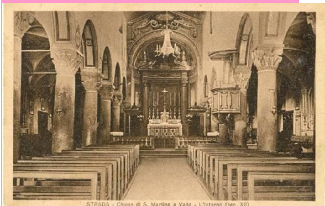
STRADA - Chiesa di S. Martino a Vado - L'Interno (sec. XII)

Sono visibili le aperture delle navate laterali che oggi non esistono più, come anche l'arco sopra la porta centrale e il locale sopra la navata sinistra.